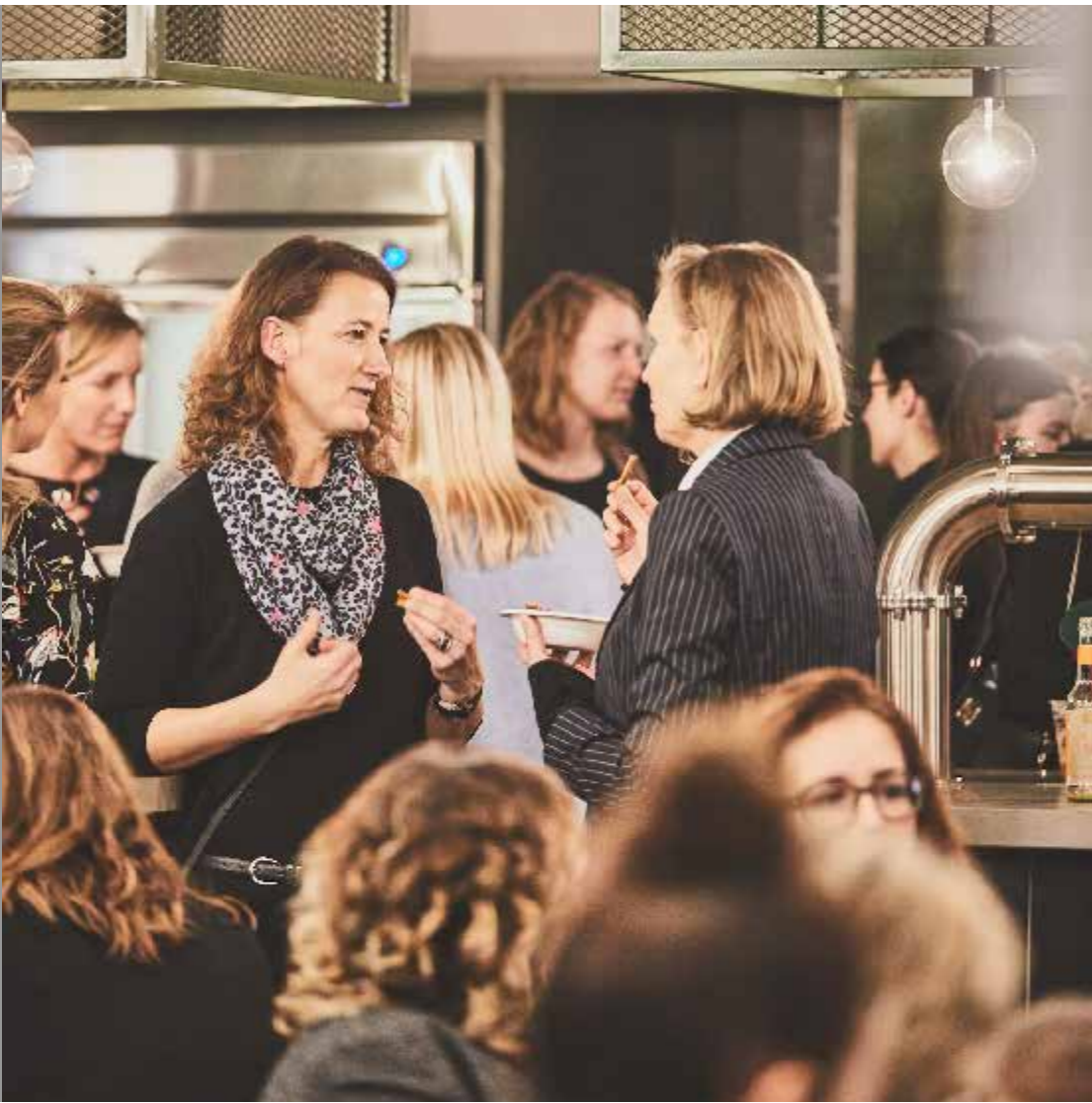
Du bist der Moderator und Ansprechpartner für deine Gäste.